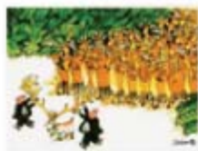
Гран при Румунија - 2001.

Багдала за децу: Радили сте илустрације и за доста књига, како за одрасле тако и за децу; а између осталог и мултимедијални Интерактивни речник за децу. Да ли је теже радити за децу или напротив, лакше?