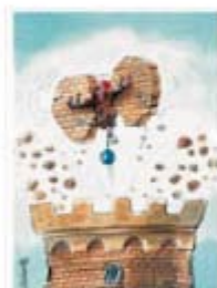
Карикатура са изложбе у Хон Конгу

Багдала за децу: Радили сте илустрације и за доста књига, како за одрасле тако и за децу; а између осталог и мултимедијални Интерактивни речник за децу. Да ли је теже радити за децу или напротив, лакше?