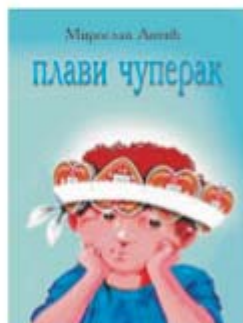
Корице за књигу Плави чуперак

Борковић: Нема бољег лека од смеха. Нема здраве заразе осим ако вас заразе смехом. Етна је најснабдевенија апотека смеха на интернету а и шире. Срдачан поздрав читаоцима Багдале за децу.