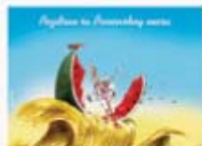
Једна од 12 Разгледница Летите на Панонском мору

Бадгала за децу: У чему сте се прво опробали: карикатура, стрип, илустрација или можда сликање, јер Ваше карикатуре по телевизији доста подсећају на слике?