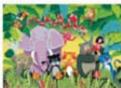
Корице за књигу Књига о цунги