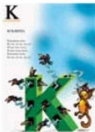
Илустрација за Азбуквар - Ршумовић

Бадгала за децу: Радили сте више серија као што су, "Тоша" или тренутно "Скривалице" које редовно излазе у "Вечерњим новостима".