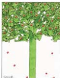
Златна медаља Пољска - 2001.