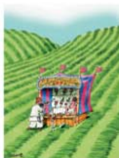
Прва награда Токио - 1985.

Багдала за децу: Нисмо поменули цртани филм, реците нам нешто о томе? Има ли још нешто што нисмо поменули што чини посету Вашег стваралачког корнуса?