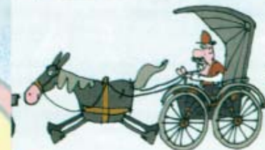
Припремио Момир Драгићевић у сарадњи са Јеленом Перковић (Делце одљење Народне Библиотеке Крушевци)

Возимо се. Покрај пута разасута села леже. Ки потоци после буре коњи јуре, лете, беже.